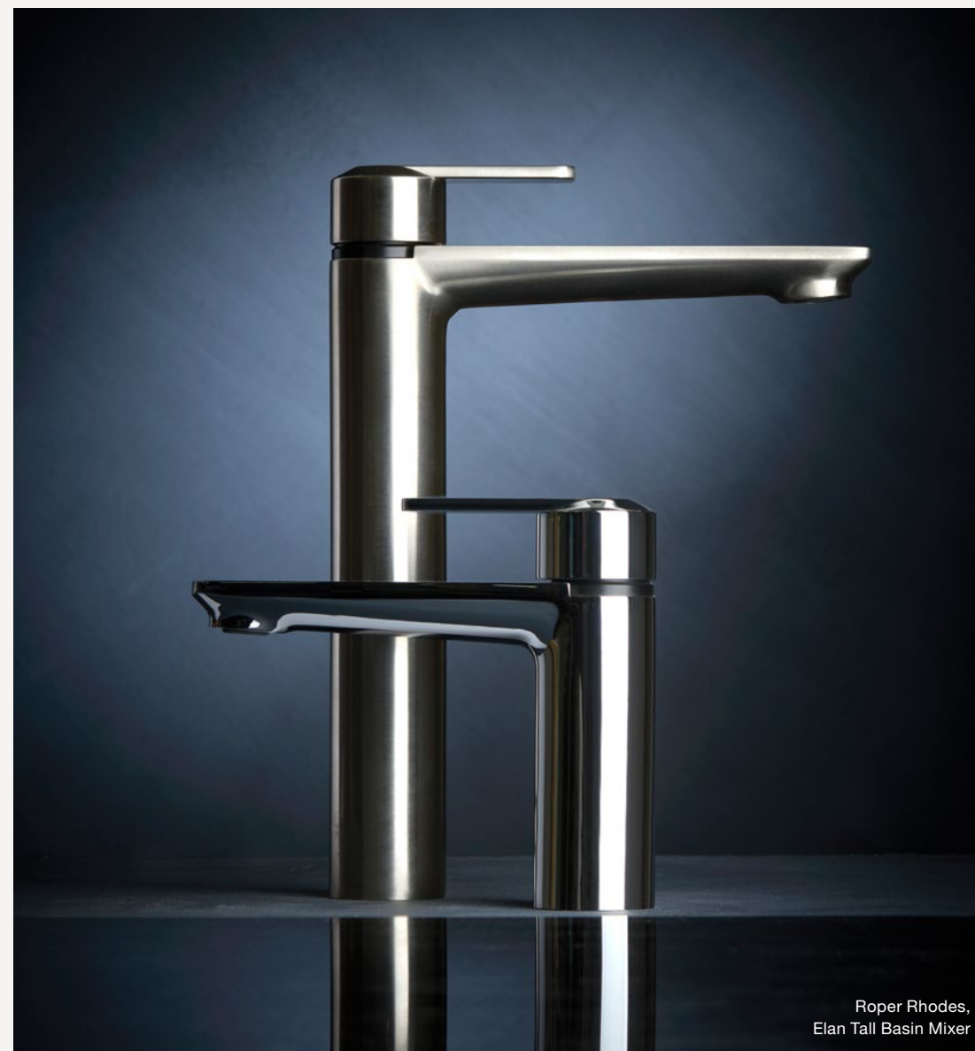
Roper Rhodes, Elan Tall Basin Mixer

Den totala ersättningen till verkställande direktören och koncernledningen framgår av not 10.